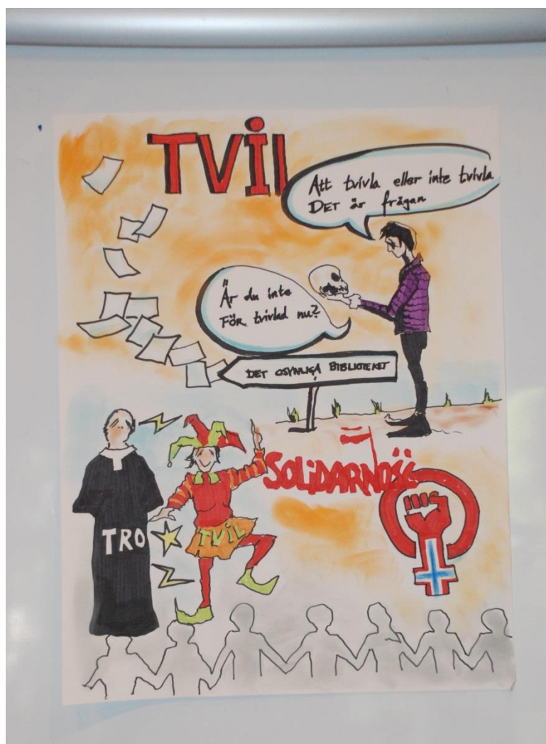
Grafisk blad fra Orion Righard, produsert under programmets gang.