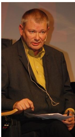
Den som er slått i dag, reiser seg i morgen. Slik lød siste strofe i det dikt som avsluttet årets konferanse.