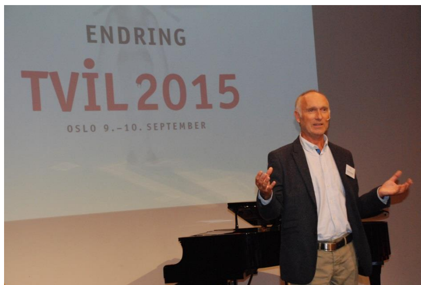
Ytterligere informasjon om TVIL2015: ENDRING kommer på www.tvil.no i løpet av januar 2015.

Tvilsdagene 2015 ønsker å belyse endringsaspektet i vår hverdag og i samfunnslivet.