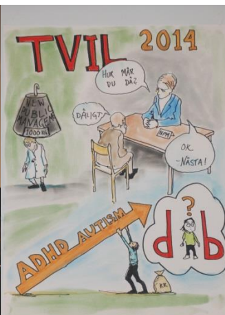
En av Orion Righards visuelle kommentarer.